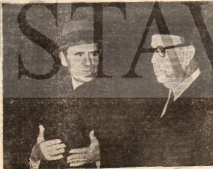
İki Dışişleri Bakanı: Gromyko - Erkin Pesrevi.