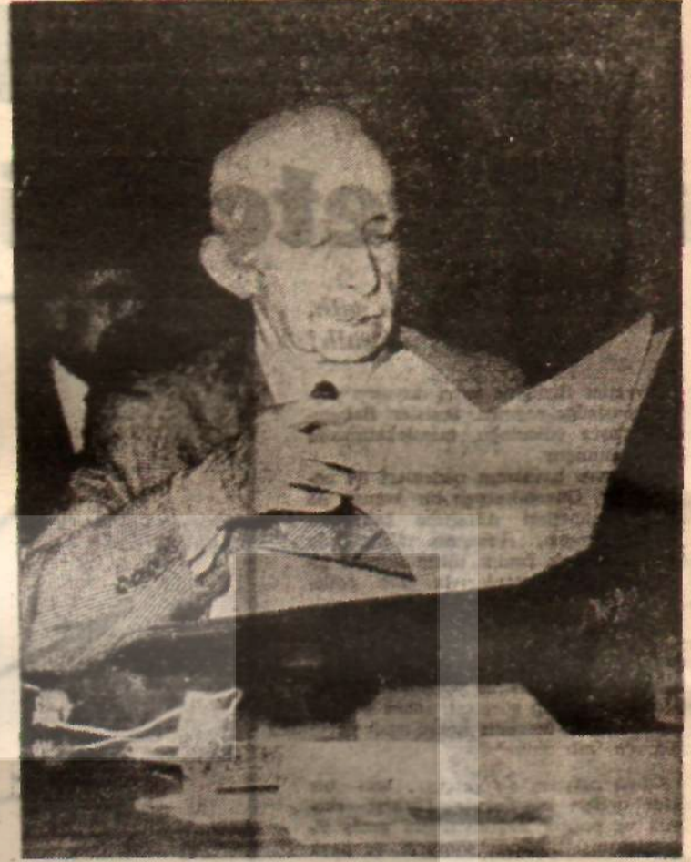
Başbakan İsmet İnönü Kökü dışarda mukavemet-yuvalarını yıkabilir

Türk - Sovyet münasebetlerini düzeltmek için ciddi sebepler vardır ve şartlar elverişlidir. Bir defa Doğu ve Batı Blokları arasında, kısa vadede sertleşmeler her zaman mümkün olmakla beraber, bir anlaşma ve uzlaşma devresine girilmiştir. Sonra Sovyetler Birliği, Türkiye'den herhangi bir top rak talebi olmadığını ve kendi rejimini kabul ettirme yolunda bir niyeti bulunmadığını defalarca açıklamıştır. Ayrıca Türkiye'nin mevcut ittifaklarına karşı bir itirazı yoktur. Batı ülkeleri uzlaşma çareleri araştırırken, bu şartlar altında bir yakınlaşmayı reddetmek, millî menfaatlerimiz açısından gerçekten bir gaflet olurdu. Ancak Amerikadan fazla Amerikacı küle bir memleket, böyle bir durumda hareketsiz kalırdı. Kaldı ki kalkınma yolundaki memleketimizin geniş ham madde ve makina istatibilecek ve kredi verebilecek durumda bulunan ve aynı zamanda ihracat mallarımız için hudutsuz pazar teşkil edebilecek olan Sovyetler Birliği ile münasebetlerini iyileştirmekten sağlayacağı büyük faydalar vardır. Kıbrıs meselesinde de, Enosis'çi Batıya karşı, bağımsızlığı savunan Sovyet görüşü, Türk tezine çok daha yakındır. Yalnız ortada, kırılması ciddi çabalara ihtivaç gösterecek olan bir güvensizlik mevcuttur. Sovyetler Birliği, Türk yakınlaşmasının Kıbrıs dolayısıyla vuku bulan geçici bir flörtten ibaret olmasından endişe etmekte ve geçici bir flört için yükleneyeceği taahhüt-