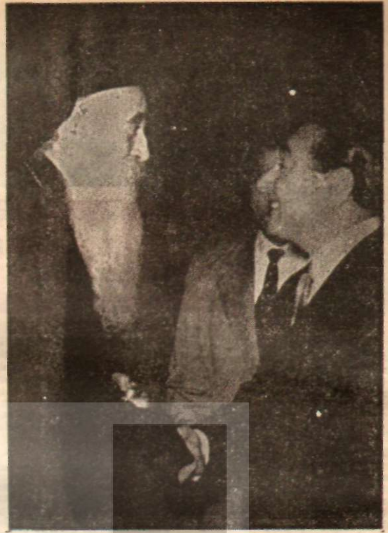
Rum Patriği Atenagoras — Adnan Menderes

İstanbul'da evrensel ökümenik bir patriklik olduğu sanısının yansamasına rağmen, bu patriklik gerçekten bütün ortodoks kiliselerinin üstünde bir makam mıdır? On-